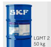
LGMT 2 50 kg