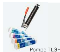
Pompe TLGH 1