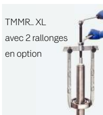
TMMR. XL avec 2 rallonges en option