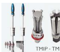
TMIP - TMIC