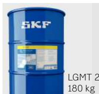
LGMT 2 180 kg