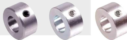
en acier en acier galvanisé en acier inoxydable