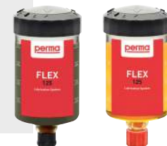
Version graisse Version huile