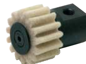
Pignon sur axe