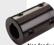
Non fendu acier bruni