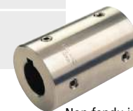
Non fendu inox