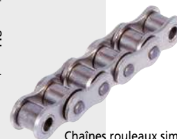
Chaînes rouleaux simple inox